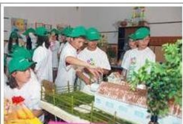
Ziua de Vest

La initiativa Smithfield Romania, peste 440 de elevi in clasele I-IV, precum si copiii angajatilor Smithfield Ferme si Smithfield Prod au participat, timp de doua saptamani, la cursuri despre mediu si colectarea selectiva a deseurilor, organizate de companie cu ajutorul cadrelor didactice din 22 de scoli din judetele Timis si Arad, in cadrul programului national "Lumea ta? Curata!". "Ne bucuram ca am reusit, de la an la an, sa crestem numarul copiilor si scolilor implicate in acest proiect de ... citeste toata stirea