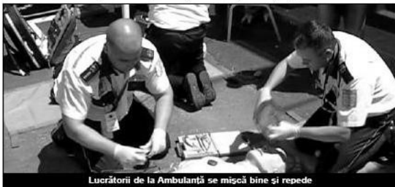
Lucrătorii de la Ambulanță se mișcă bine și repede