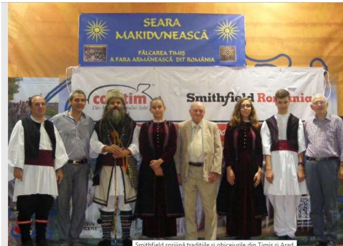
Smithfield sprijină tradițiile și obiceiurile din Timiș și Arad