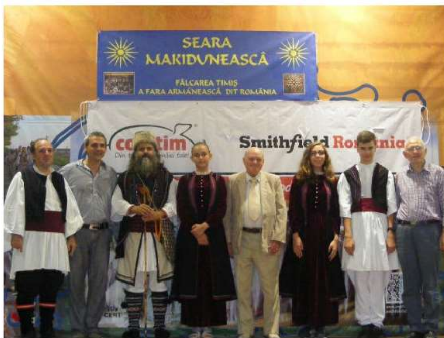
De 9 ani, Smithfield sprijina tradițiile și obiceiurile locale din județele Timiș și Arad în cadrul programului "Fii unul dintre noi"