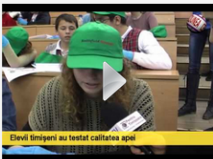
Elevii timiseni au testat calitatea apei