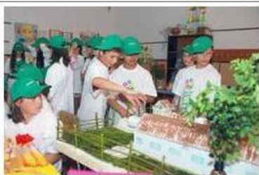
Ziua de Vest

La initiativa Smithfield Romania, peste 440 de elevi in clasele I-IV, precum si copiii angajatilor Smithfield Ferme si Smithfield Prod au participat, timp de doua saptamani, la cursuri despre mediu si colectarea selectiva a deseurilor, organizate de companie cu ajutorul cadrelor didactice din 22 de scoli din judetele Timis si Arad, in cadrul programului national "Lumea ta? Curata!". "Ne bucuram ca am reusit, de la an la an, sa crestem numarul copiilor si scolilor implicate in acest proiect de ...citeste toata stirea