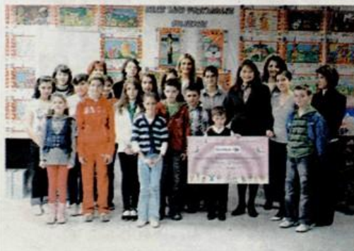
255.000 élèves de 670 écoles de 14 villes ont participé au traditionnel concours de dessins organisé par Carrefour Roumanie. Une exposition avec ces dessins a été organisée dans les hypermarchés Carrefour de tout le pays et de nombreux prix ont été attribués pour les meilleures œuvres. 14 des talentueux et chanceux enfants participants au concours ont été récompensés d'une excursion à Disneyland Paris.