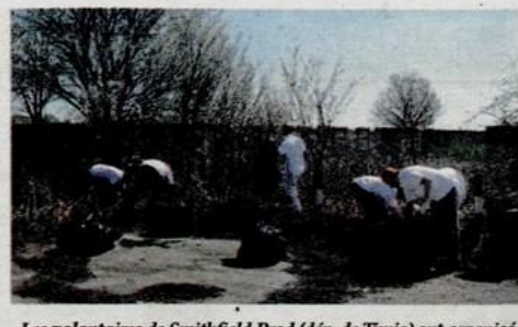
Les volontaires de Smithfield Prod (département de Timis) ont organisé entre le 26 mars et le 2 avril une "Semaine verte" au cours de laquelle 200 arbres ont été plantés, 112 sacs de déchets ont été ramassés et on a compté 400 actions de volontariat et d'activité d'information et protection de l'environnement.