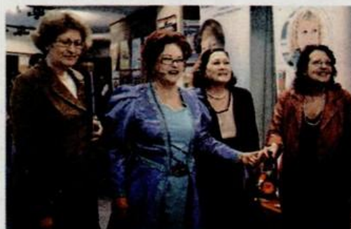
L'Association "ACCES" a organisé le Dimanche des Rameaux un spectacle et un don de jouets en faveur des enfants malades d'asthme et d'ADHD, dans le but de favoriser leur intégration scolaire et sociale.