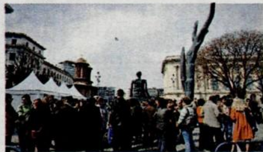
Les médecins de famille ont protesté dans la rue la semaine dernière mécontents des contraintes imposées par le nouveau contrat-cadre qu'ils devraient signer avec la Caisse Nationale d'Assurances Sociales. Pendant une semaine ils ont aussi refusé de signer tout acte médical officiel: congés médicaux, recettes gratuites, etc.