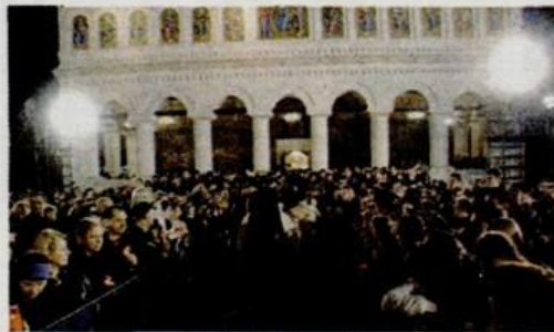
Les Roumains ont célébré les Pâques dans le calme cette année. Selon la Police, le nombre d'infractions et d'accidents a diminué visiblement, ainsi que le nombre des appels aux services médicaux d'urgence. La crise a fait que moins de touristes passent leurs courtes vacances de Pâques dans les stations de montagne ou sur le littoral roumain.